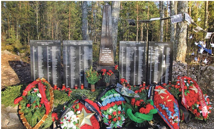
Мемориал на острове Клест

Война отрывает людей от дома, обрекая на фронтовые дороги или скитания в эвакуации. И она же скрепляет незнакомых людей единой судьбой, выполнением общей задачи. Своими незримыми нитями война может соединить весь народ. И хотя от Купчино очень далеко до острова Клест в Выборгском заливе, именно сюда привели поиски родных погибших солдат.