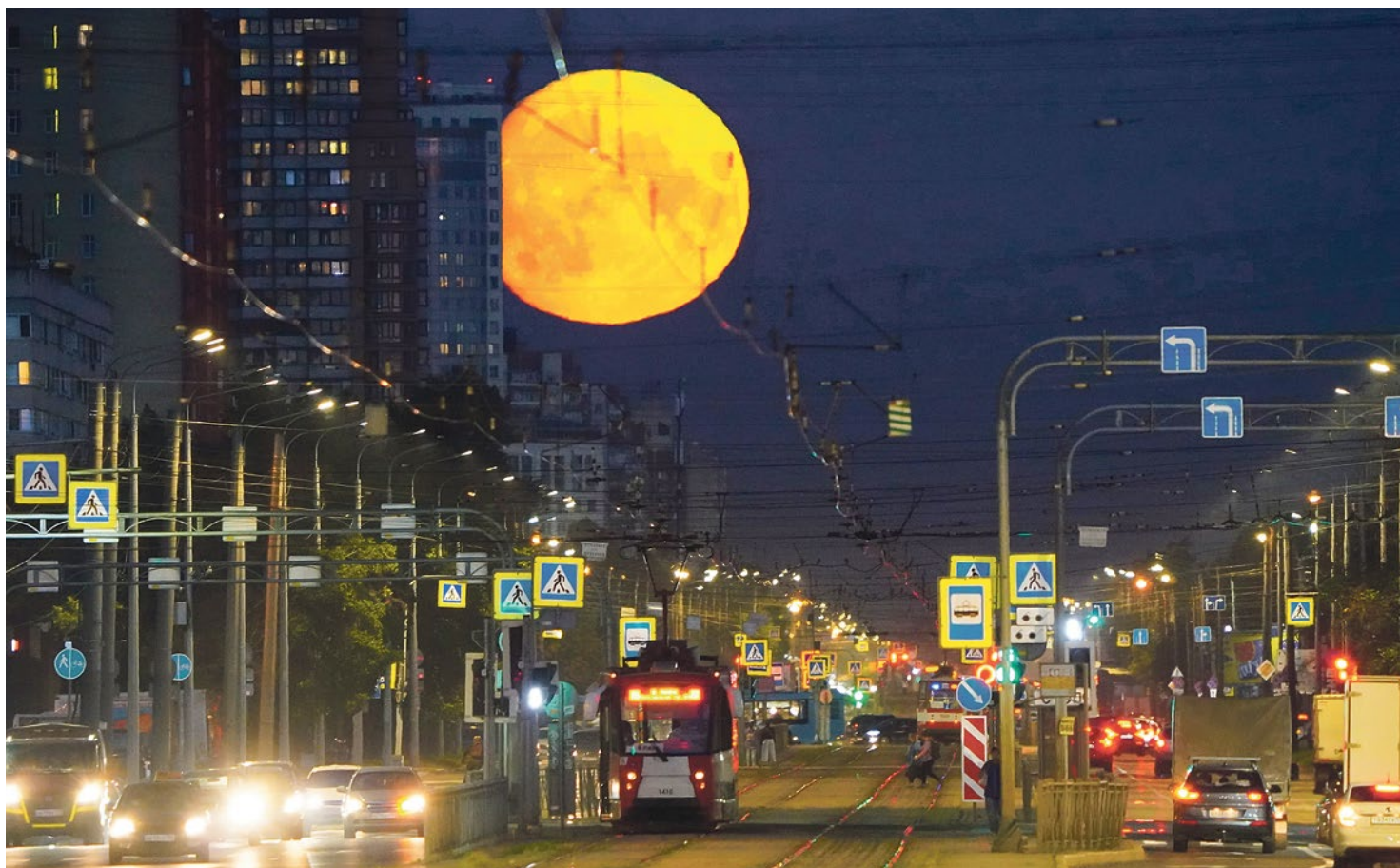
Владислав Васильев. Восход Луны на Бухарестской улице, 2022 г.